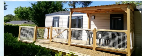
MOBIL-HOMES dont 2 modèles adaptés PMR